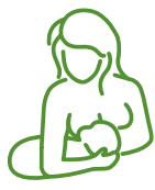
posición de fútbol americano